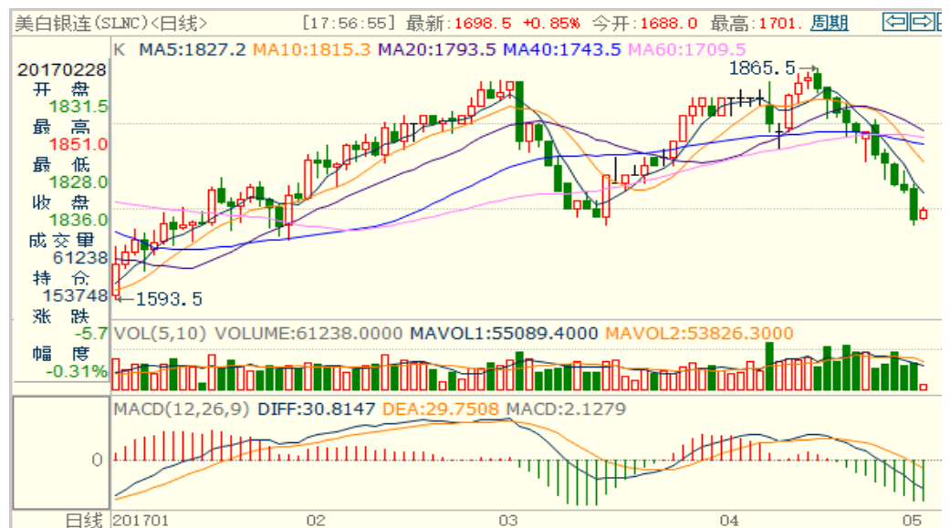
图 2：COMEX 白银主力合约技术分析

COMEX 白银上周大幅下跌，下方面临 17 美元/盎司的支撑位，本周或围绕支撑位震荡，国内白银或略偏弱。