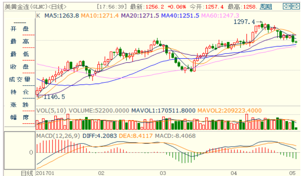
图 1：COMEX 黄金主力合约技术分析

COMEX 黄金上周震荡下跌，下方支撑位 1250 美元/盎司，本周或围绕支撑位震荡偏空。