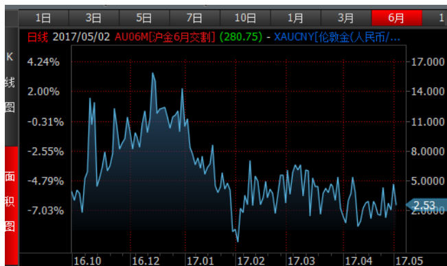
图 3、沪金 6 月-伦敦金 (人民币/克) 溢价近期低位震荡 图 4、沪银 6 月-伦敦银 (人民币/千克) 溢价近期震荡